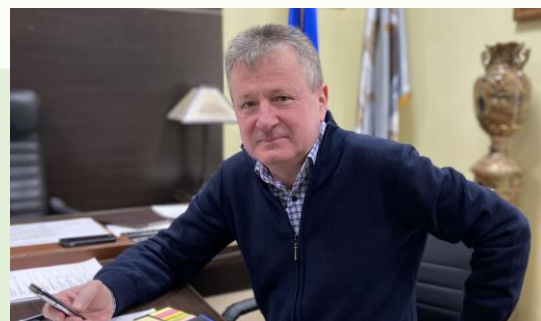
Іван Ковач, Тячівський міський голова