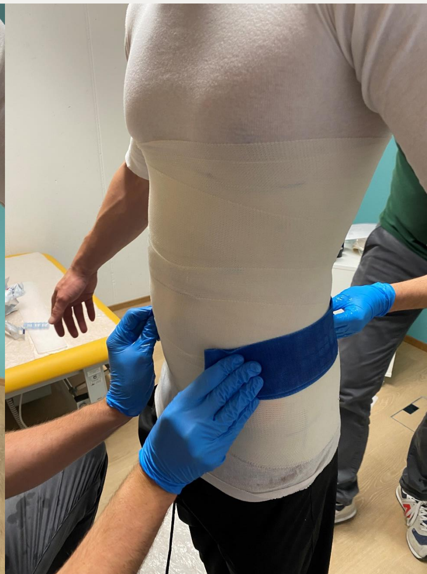
3. Розміщення жорстко стегно