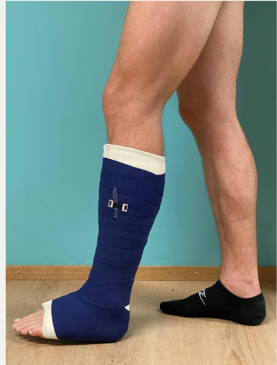
10. Розрізаний гіпс для ходьби