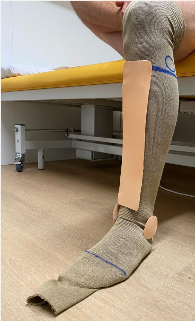
1. Трикотажна панчоха / прокладочний матеріал