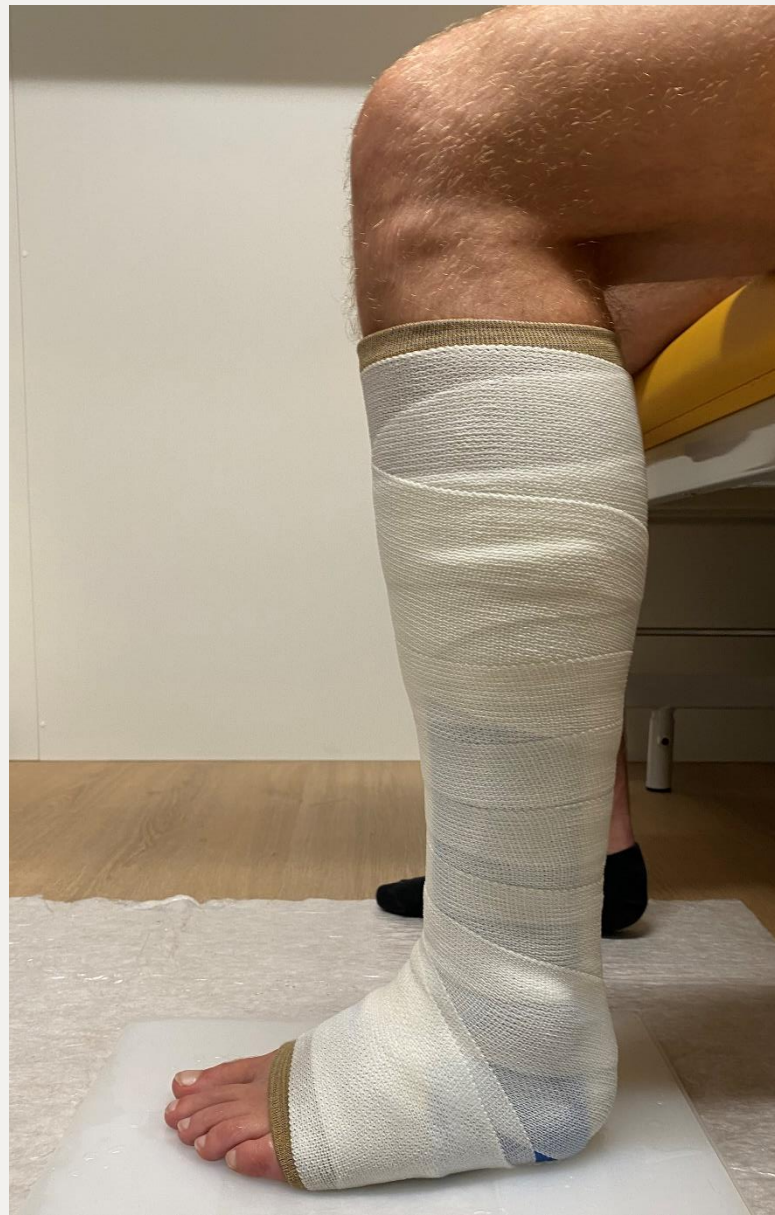
5. Позиція стопи 90°