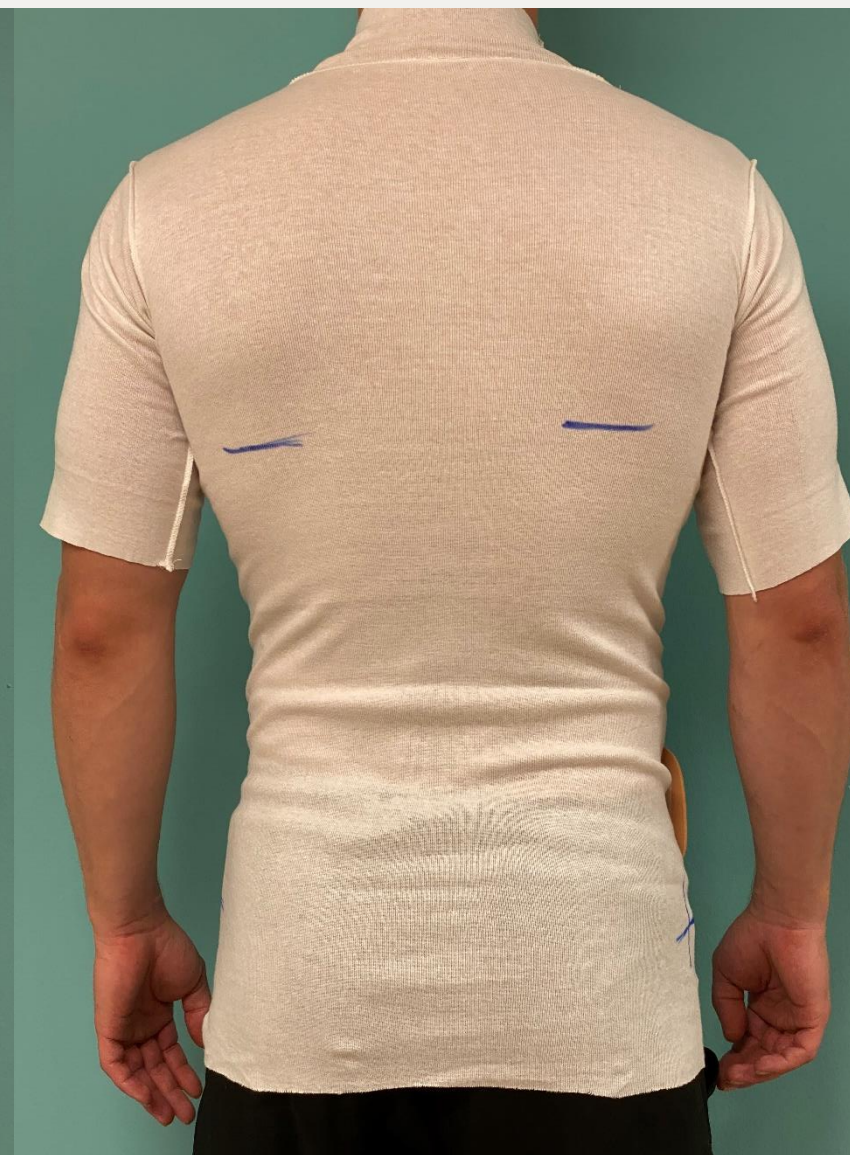
1. Захист тіла/Пом'якшення