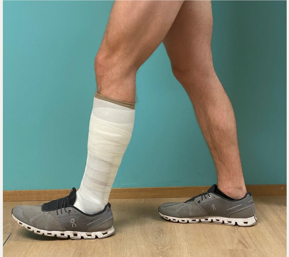
7. Готовий (фіксований) гіпс для ходьби