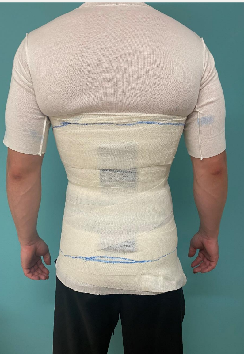
8. Готовий корсет для фіксації, дорзально