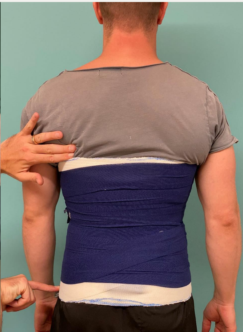
12. Зафіксувати корсет перев'язочним матеріалом