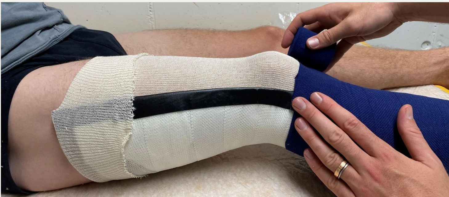
4. Фіксація тильної оболонки еластичним бинтом