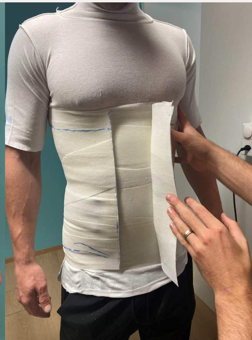
10. Відкриття корсету для фіксації