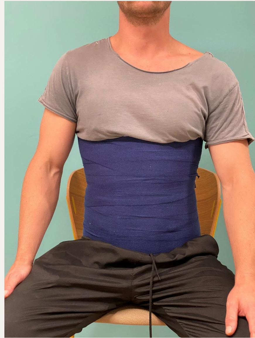
15. Вентральний вид в положенні сидячи