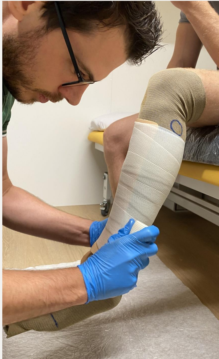
2. Перше обмотування (напівжорстке), трикотажну