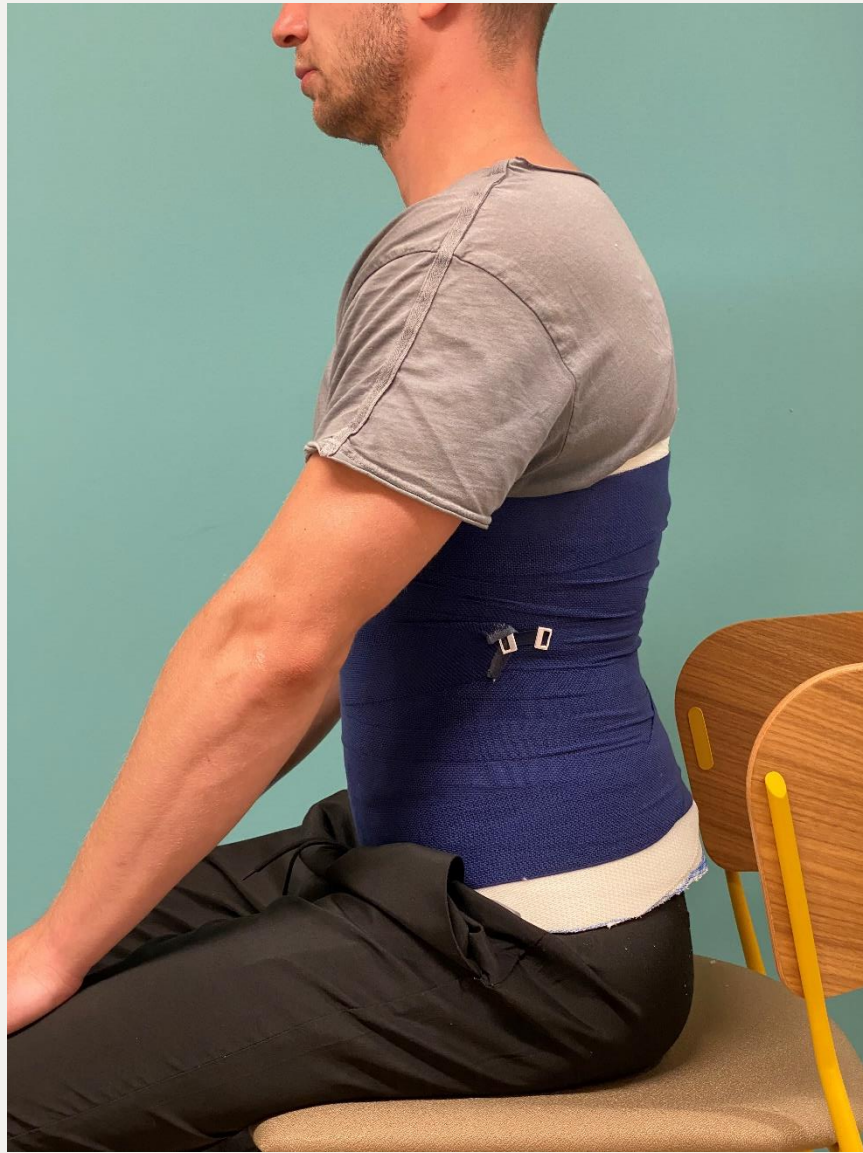
14. Вид збоку в положенні сидячи