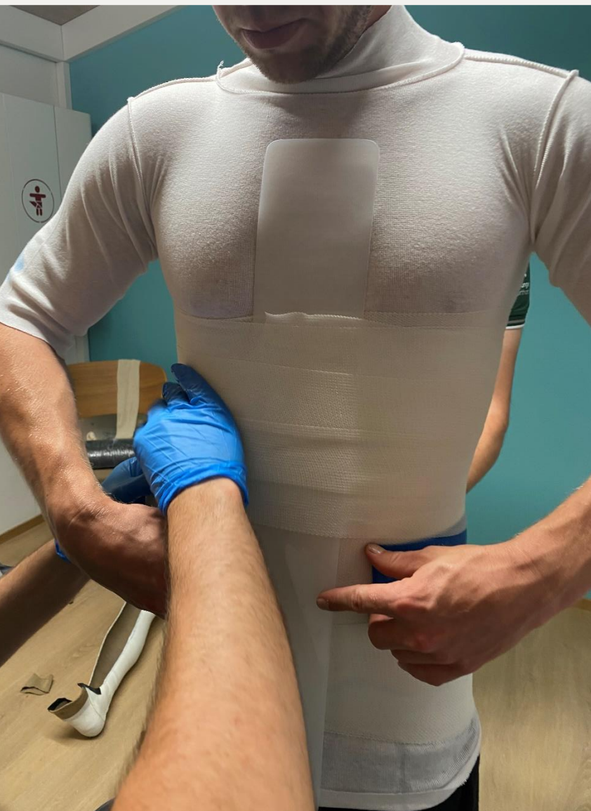
5. Друге обмотування з розміщенням допомоги для розрізання