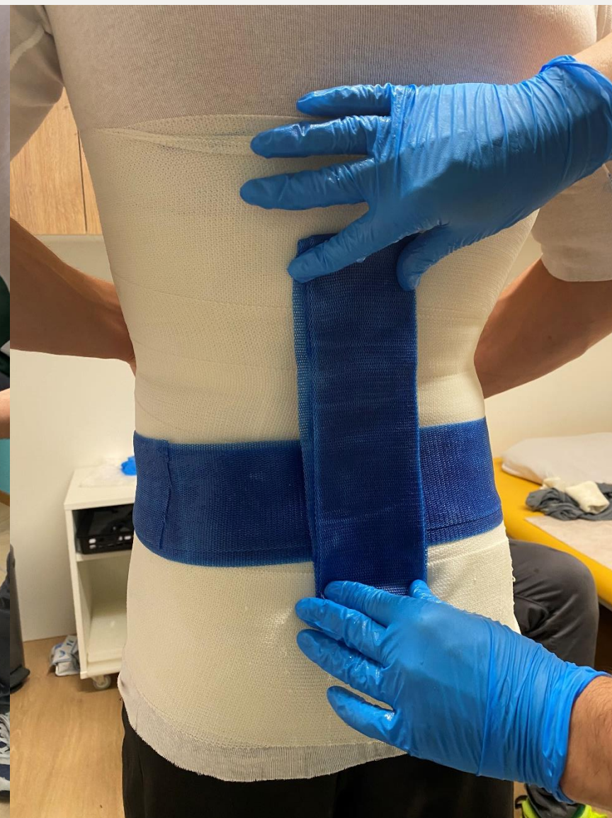
4. Розміщення жорстко спина