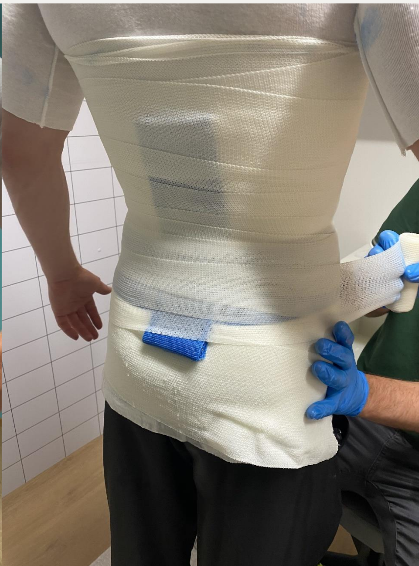
6. Друге кругове обмотування