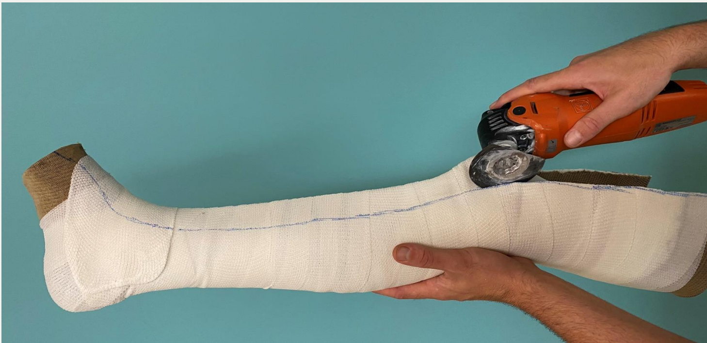
3. Розрізання дорсальної частини шини