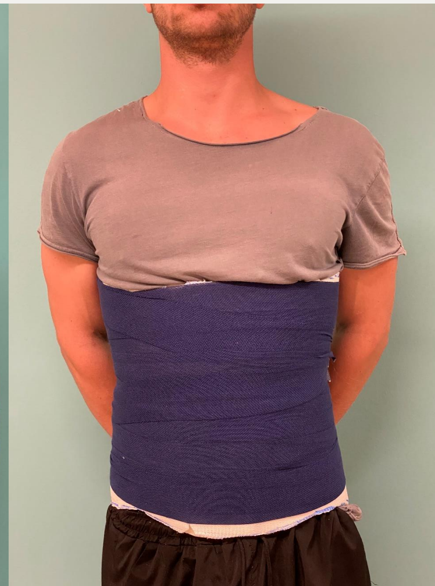
13. Вигляд вентрально