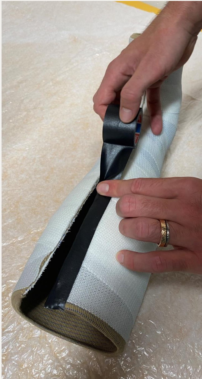
8. Краї заклеїти скотчем