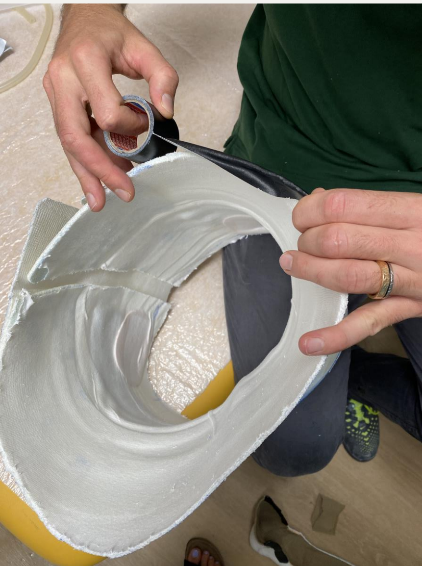
11. Обклеїти краї