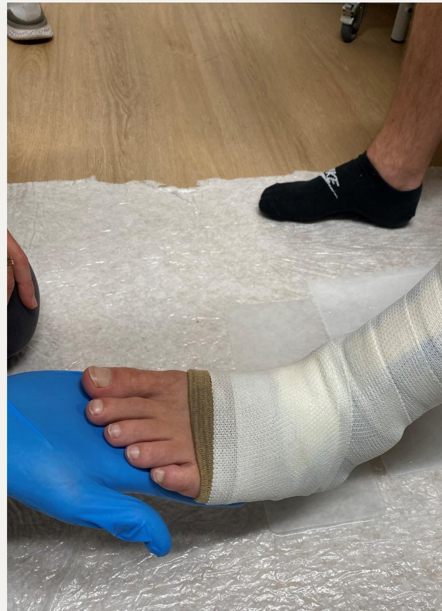
6. Також можливо з пластиною для передньої частини стопи