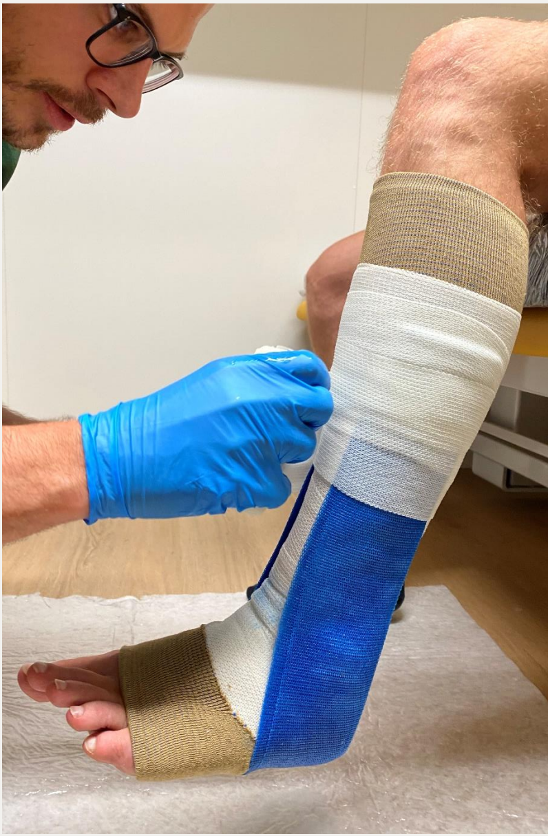
4. Друге обмотування (напівжорстко)