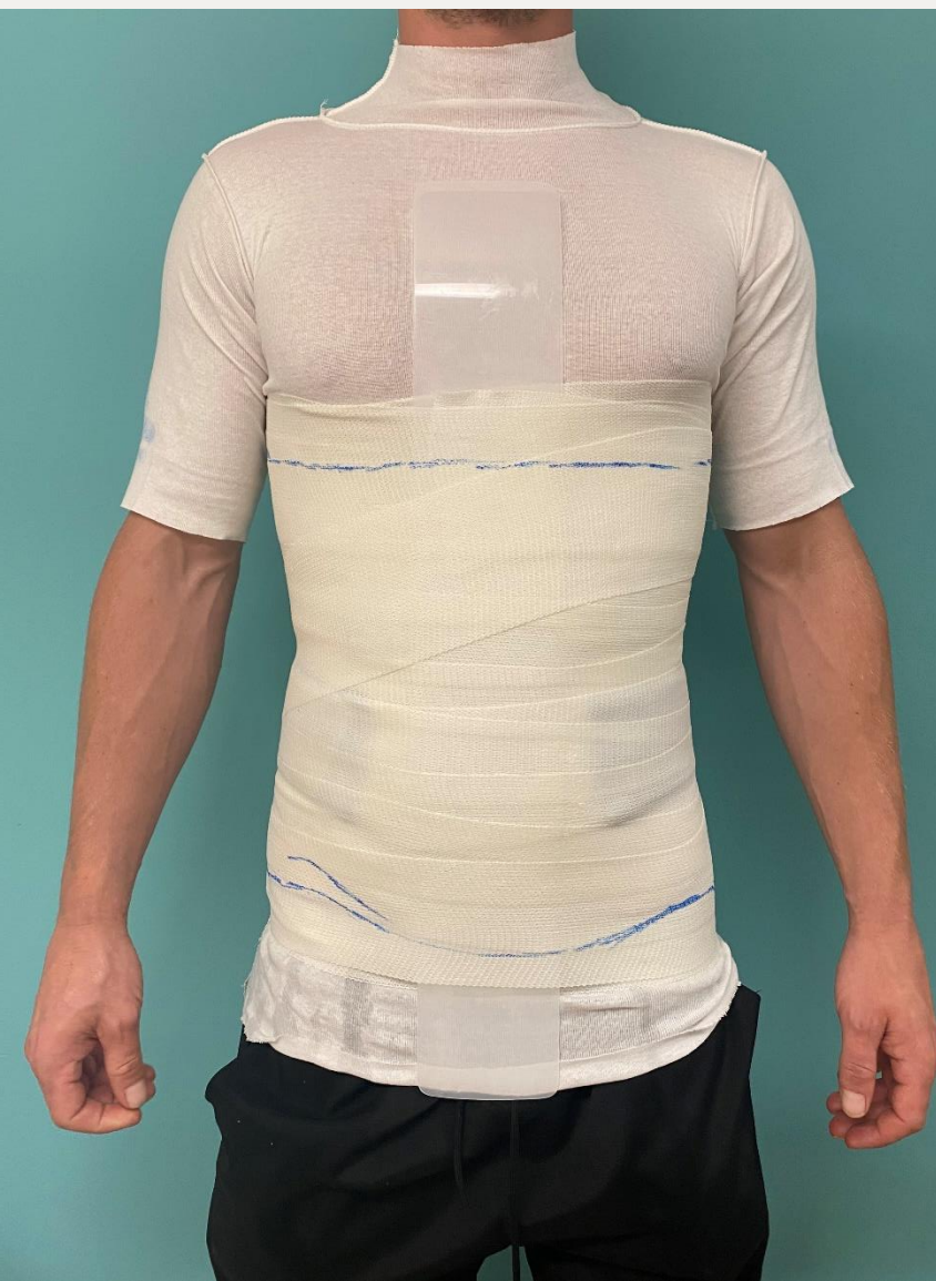
9. Готовий корсет для фіксації, вентрально