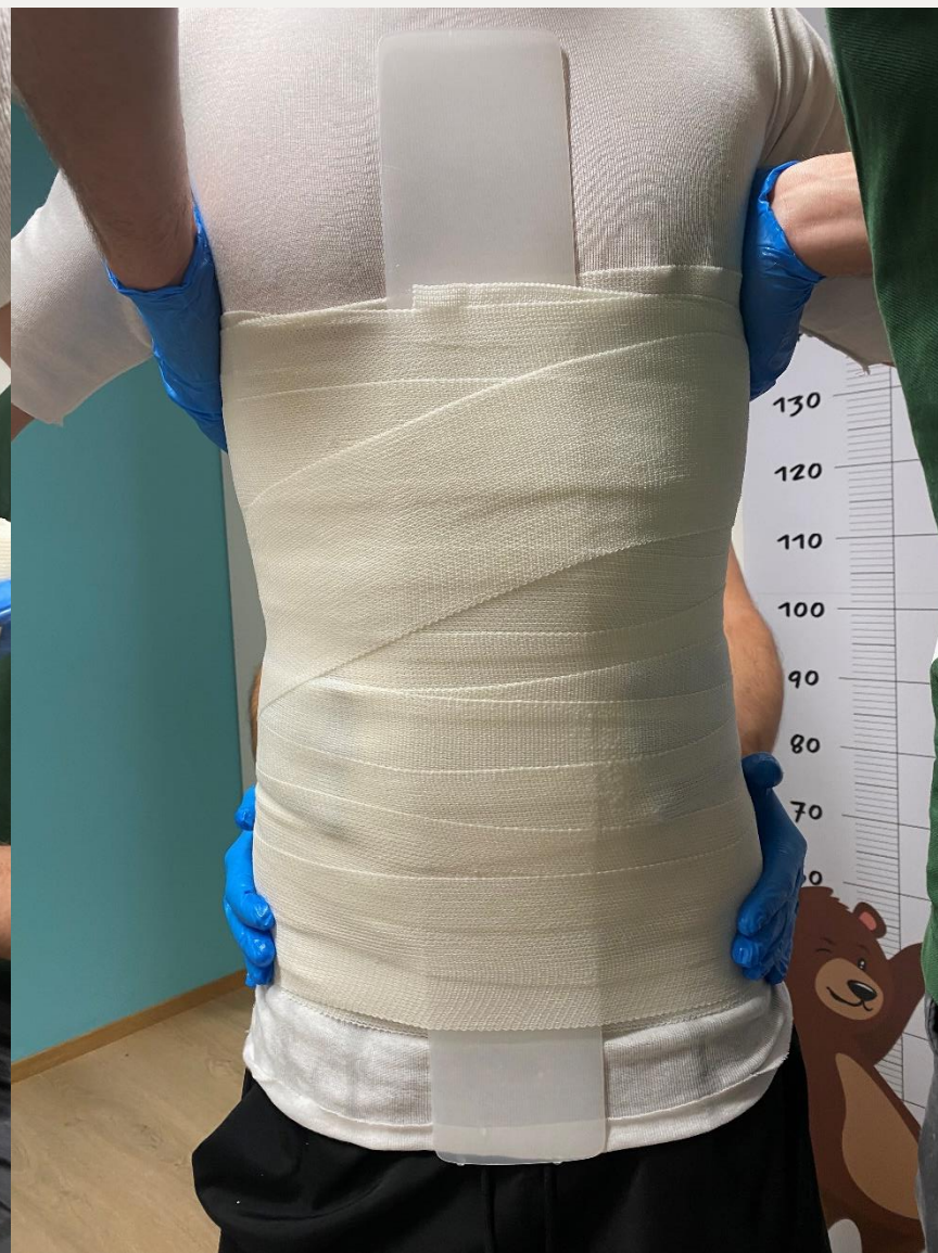
7. Позиціонування постави