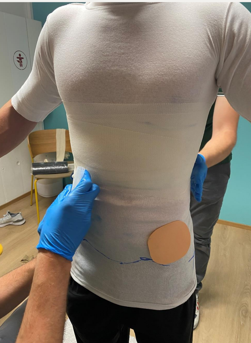
2. Перше обмотування