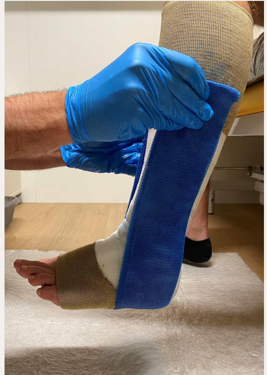
3. Жорстке фіксування та моделювання